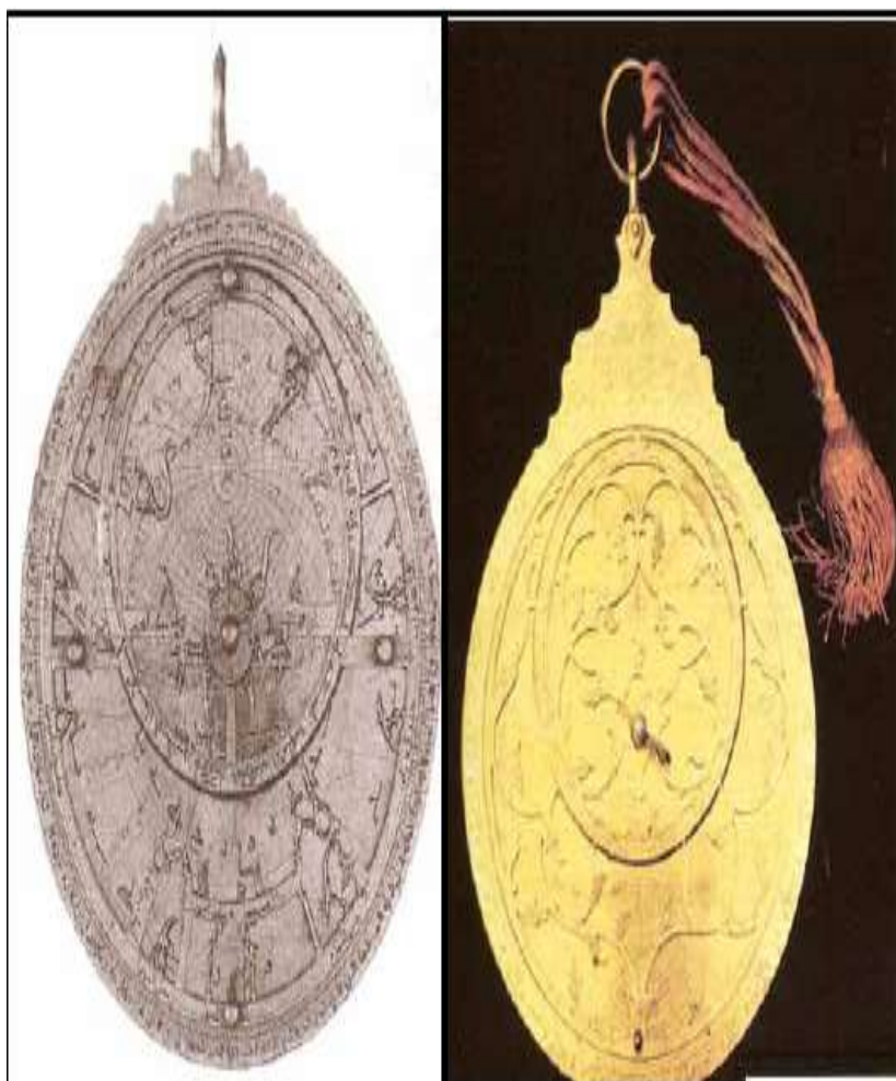
پاشکوی ژماره ۸)

چند وینہ یہ کی دیکھی ٹامپری (الأسطرلاب) کہ لہ مؤزہ خانہ کاندہ پاریراون