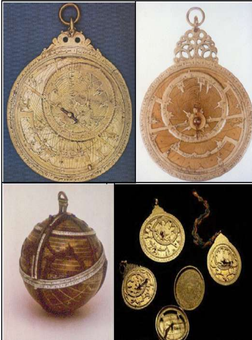
پاشکوی ژماره (۷)

چند وینه‌یه‌کی دیکه‌ی ئامیری (الأسطرلاب) که له موزه‌خانه‌کاندا پارێزران