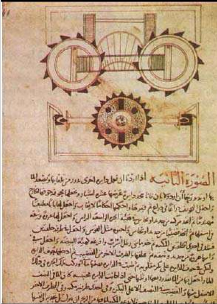
پاشکوی ژماره (۳)

یه کیک له کتیبه وه رگتیردراوه کان (فیلون الأسکندری) بۆ زمانی عه ره بیی که باس له ئامیژیکی به رزکردنه وهی ئاو دهکات